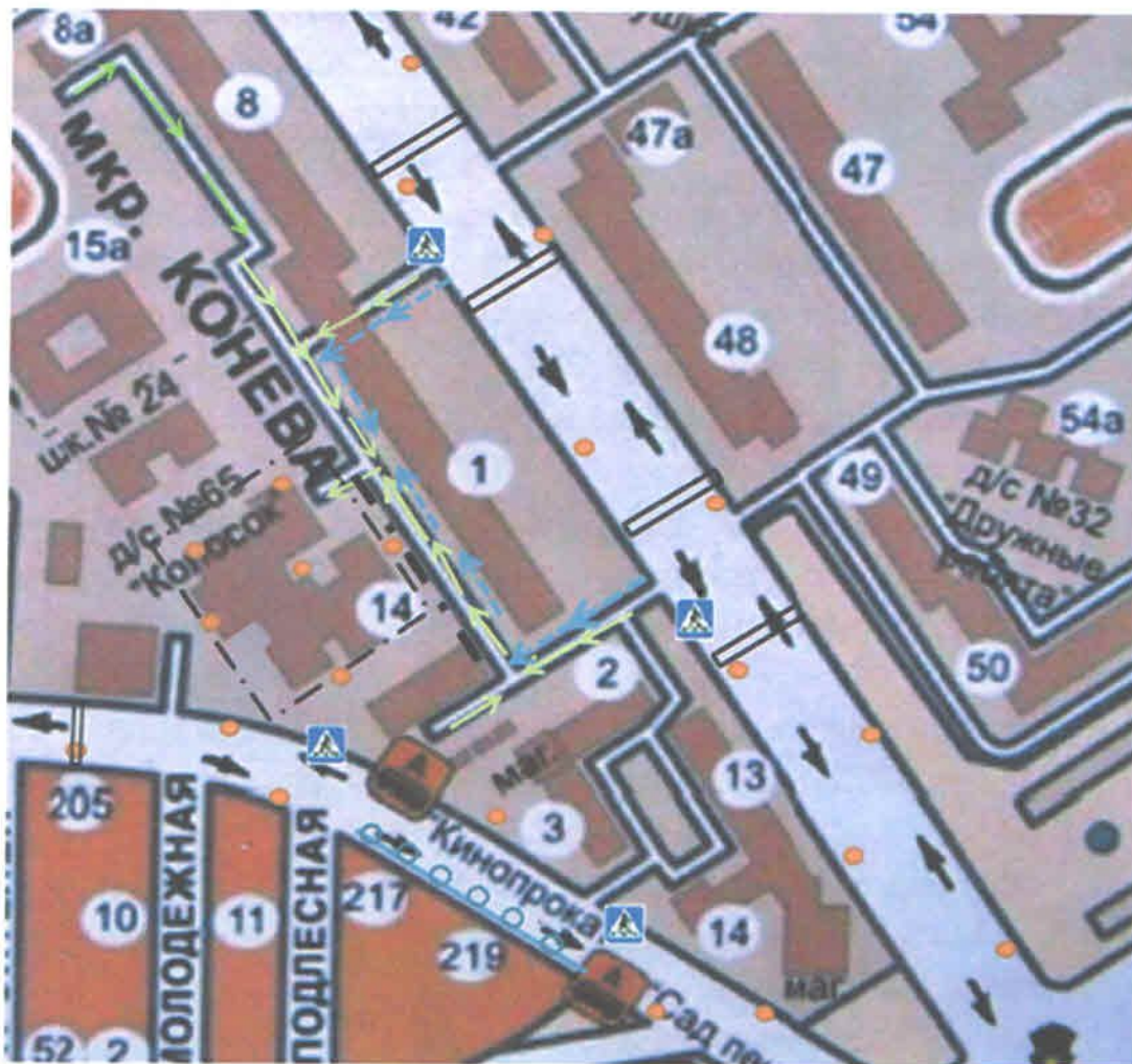
Схема организации дорожного движения в непосредственной близости от образовательной организации с размещением соответствующих технических средств организации дорожного движения, маршруты движения детей и расположение парковочных мест